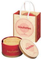
ゴーフレットミニ 650円