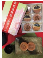
観劇饅頭 (6個) 1,000円