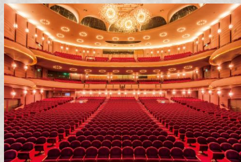
梅田芸術劇場メインホール

ご希望の日程・席数・団体名・利用交通機関など 詳細を営業担当社員宛てにご連絡ください 概ね3営業日以内（土日祝日除く）に回答いたします